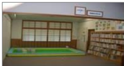
Sucursal Norte (Miwa)