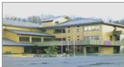
Biblioteca de Sakahogi