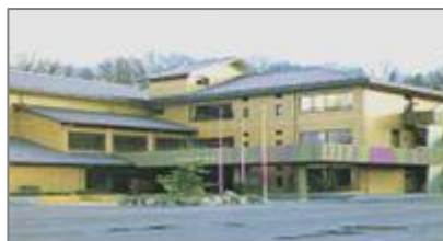
Biblioteca de Sakahogi