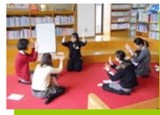
4組の親子さんの参加でした。

「おはながわらった」を1人のお母さんが知ってみえるよう でした。でも、多くの人に知ってもらいたい…。そんな思いか ら、何度も繰り返し行ないたいと思います。