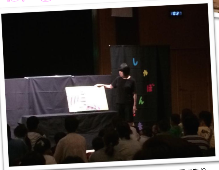
次の舞台準備の繋ぎとして1作。観客を待たせない工夫あり。