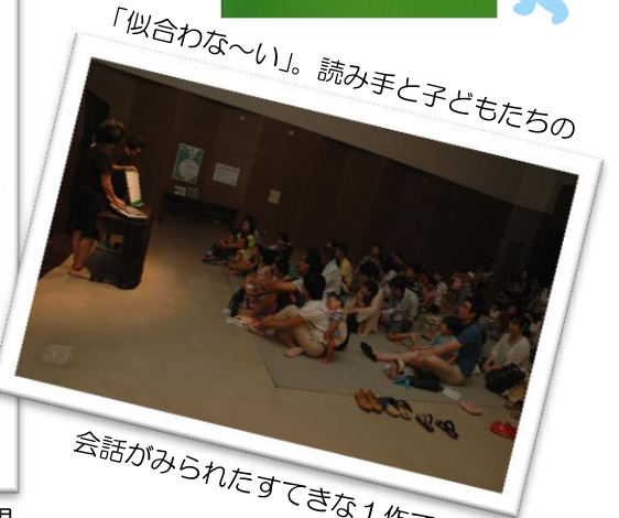
「似合わな〜い」。読み手と子どもたちの