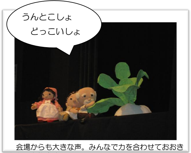
会場からも大きな声。みんなで力を合わせておおきなかぶを抜きました。