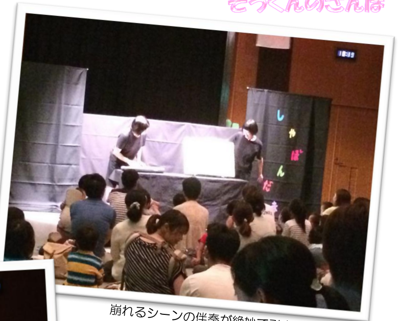
崩れるシーンの伴奏が絶妙で引き込まれる。