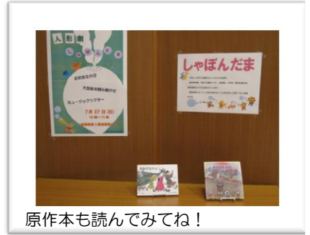
原作本も読んでみてね！