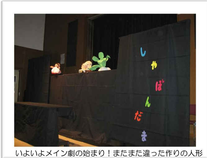
いよいよメイン劇の始まり！またまた違った作りの人形たちが現れる。細かい動きに舞台裏が気になりました。