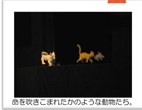
命を吹きこまれたかのような動物たち。

それぞれ違った趣向の出し物で、飽きることなく楽しめた1時間でした。手作りの人形に生伴奏、笑い、などなど。「しゃぼんだま」ならではの世界に子どもたちも大満足！大人の私たちも、おはなしに入り込む楽しさに改めて浸ることができました。